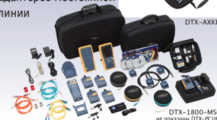
DTX-1800-MSO не показаны DTX-PCU6S и DTX-PLCAL

Если Вы ищете возможность обмена 5 старых кабельных анализаторов на современные анализаторы, то наиболее выгодный способ это оценить преимущества перечисленных комплектов, и сдать нам старые приборы. Вы приобретаете пять DTX, и получаете один DTX в подарок после сдачи нам 5-ти старых кабельных анализаторов Cat 5/5E/6.